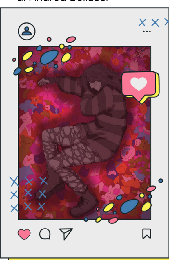
3A Audiovisivo Multimediale Liceo Artistico Fabriano