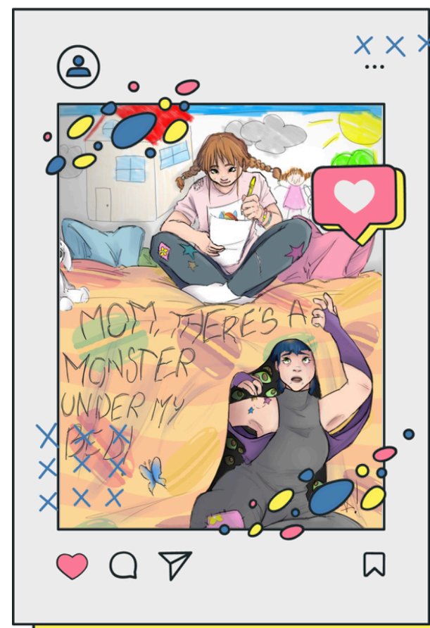
3A Audiovisivo Multimediale Liceo Artistico Fabriano