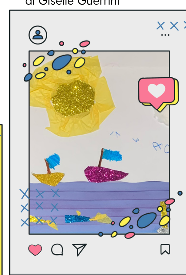
Secondo anno Scuola dell'Infanzia

Per tutte le giornate la Fontana del Calamo sarà illuminata di BLU in adesione all'iniziativa "Go Blue" UNICEF ANCI