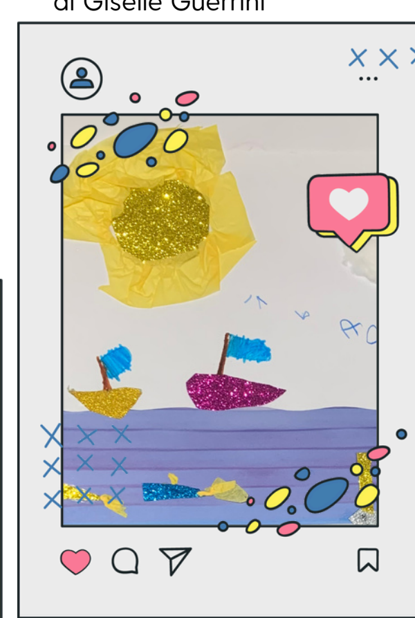
Secondo anno Scuola dell'Infanzia

Per tutte le giornate la Fontana del Calamo sarà illuminata di BLU in adesione all'iniziativa "Go Blue" UNICEF ANCI