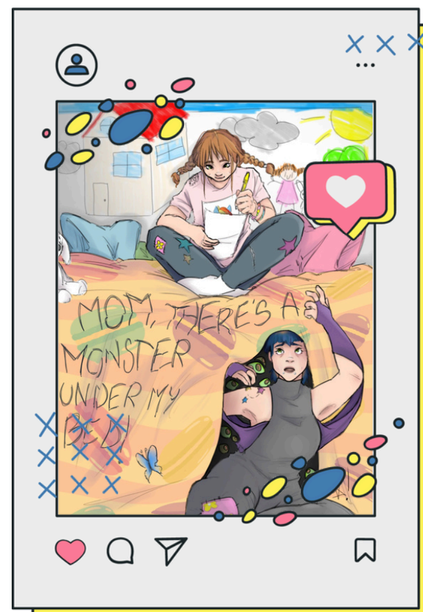
3A Audiovisivo Multimediale Liceo Artistico Fabriano