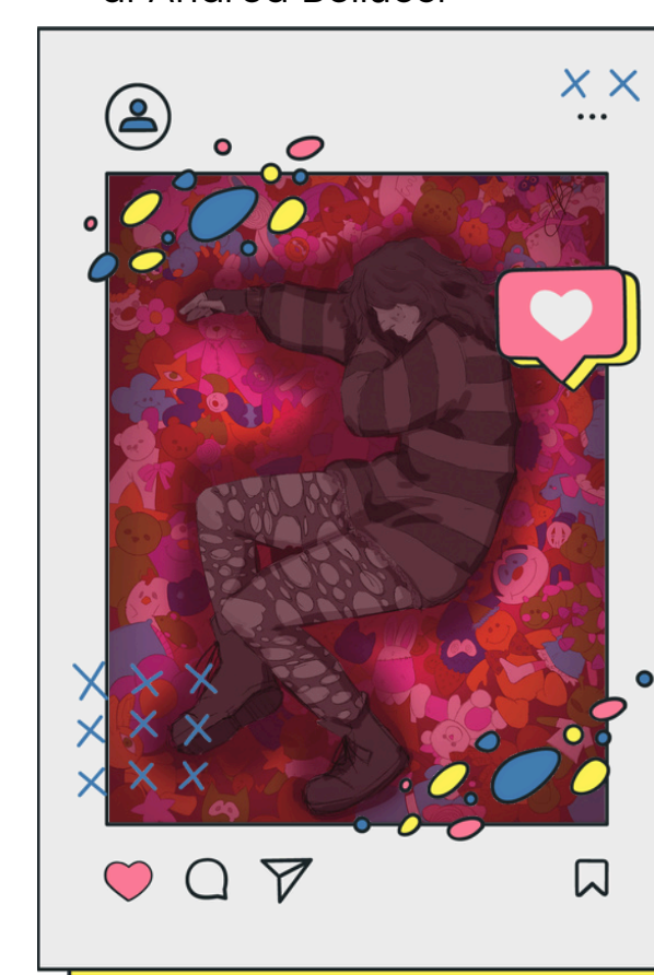
3A Audiovisivo Multimediale Liceo Artistico Fabriano