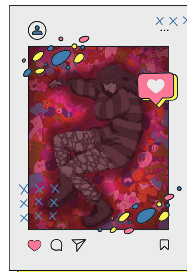
3A Audiovisivo Multimediale Liceo Artistico Fabriano