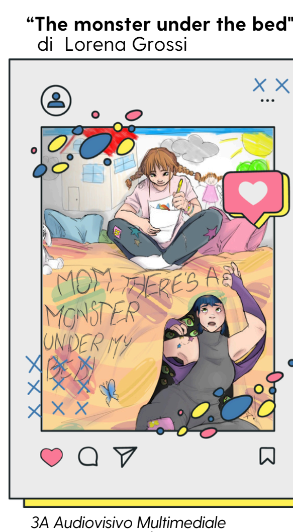
3A Audiovisivo Multimediale Liceo Artistico Fabriano