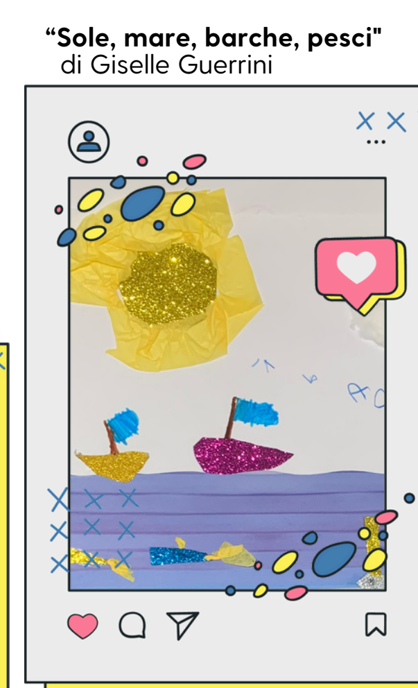
Secondo anno Scuola dell'Infanzia