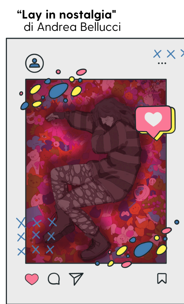
3A Audiovisivo Multimediale Liceo Artistico Fabriano