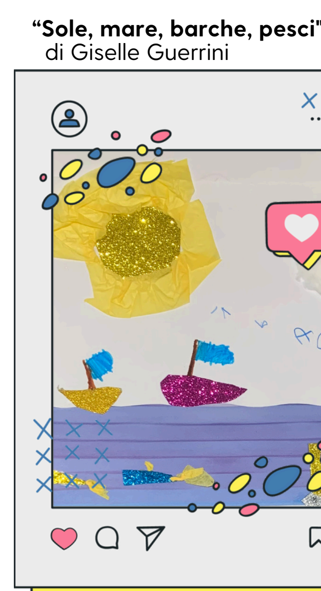
Secondo anno Scuola dell'Infanzia

Per tutte le giornate la Fontana del Calamo sarà illuminata di BLU in adesione all'iniziativa "Go Blue" UNICEF ANCI