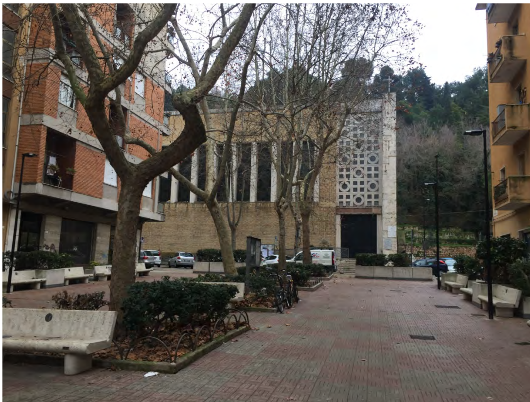
Immagine 3: Vista dalla piazza verso la chiesa