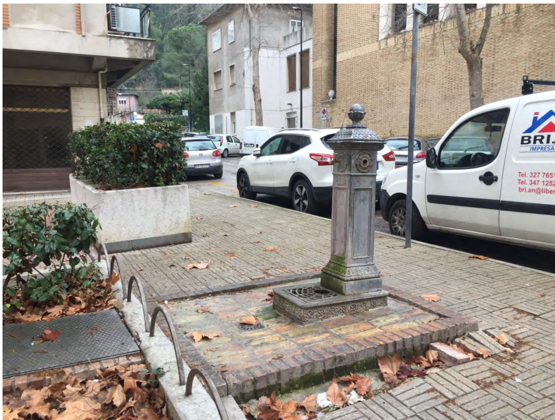
Immagine 15: Dettaglio della fontana