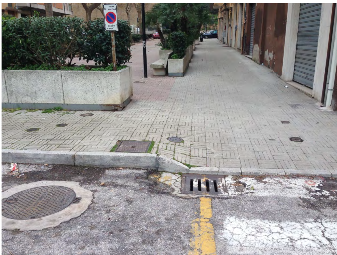
Immagine 10: Particolare del marciapiede e caditoia