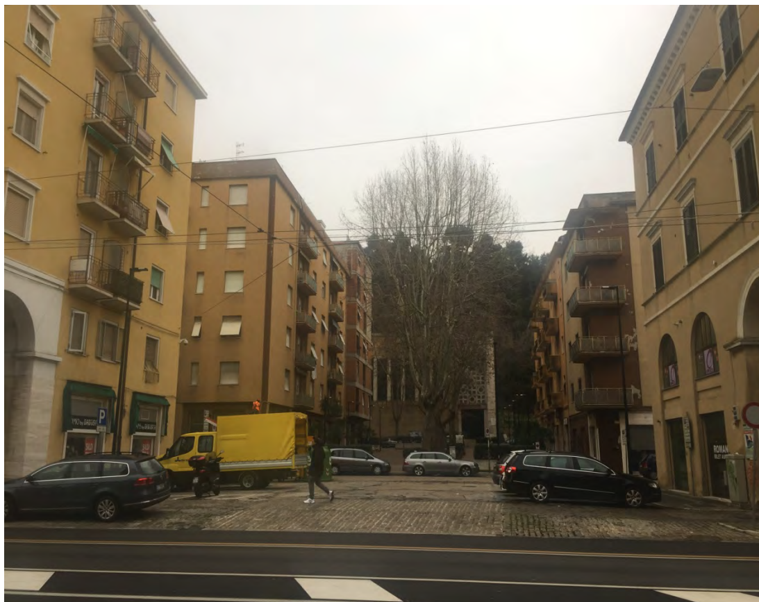
Immagine 1: Vista da via G. Marconi