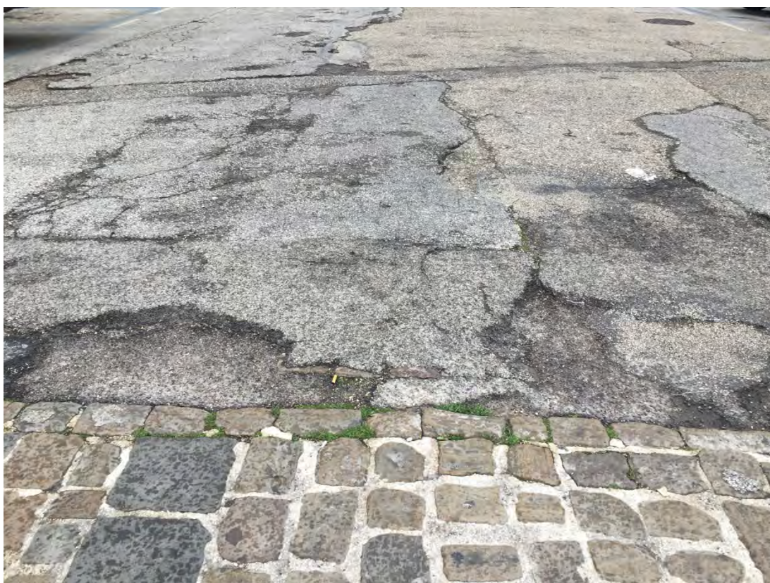
Immagine 8: Particolare della pavimentazione