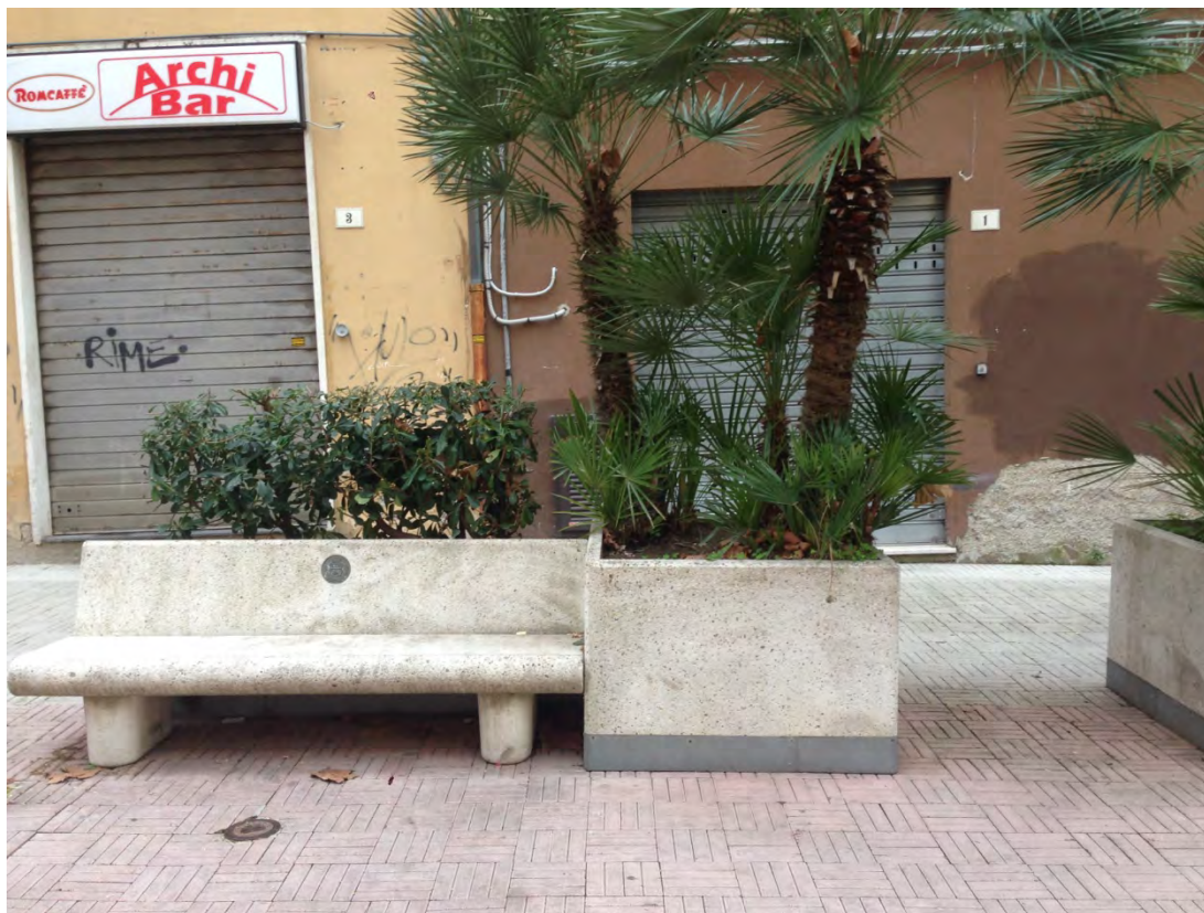
Immagine 13: Dettaglio della panchina e fioriera