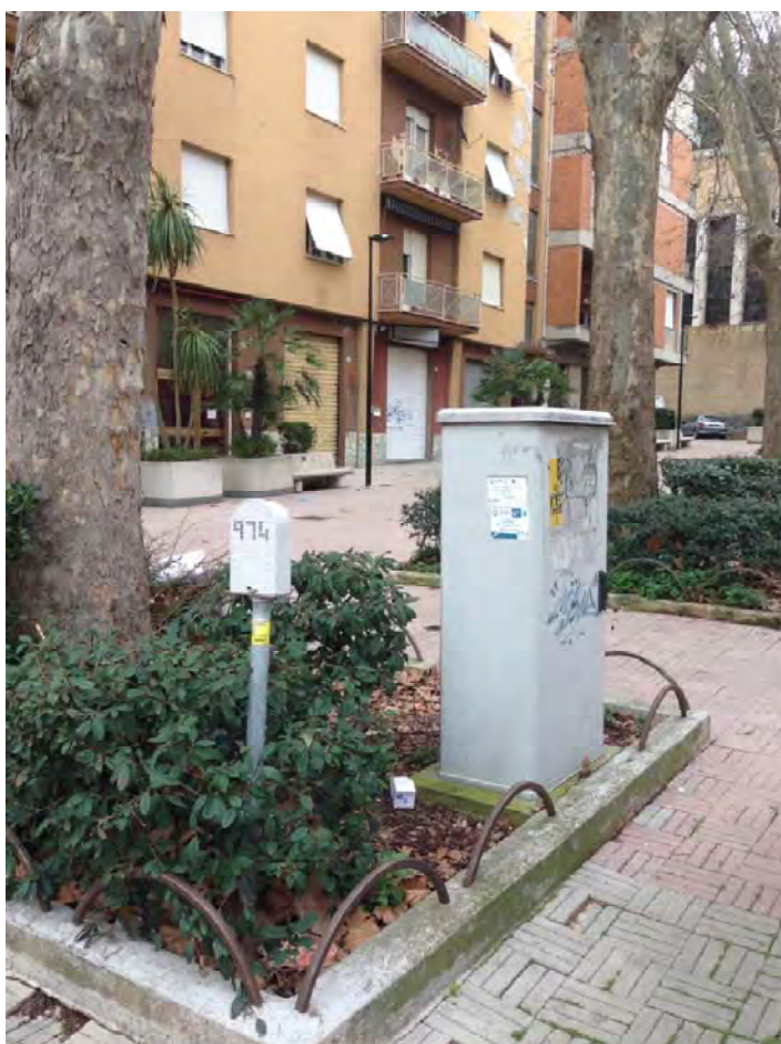
Immagine 12: Dettaglio piazza interna