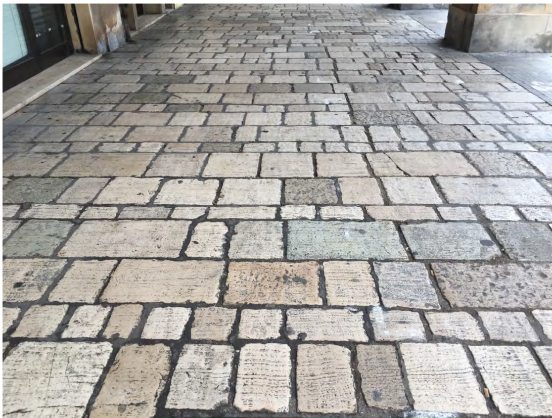
Immagine 7: Particolare della pavimentazione