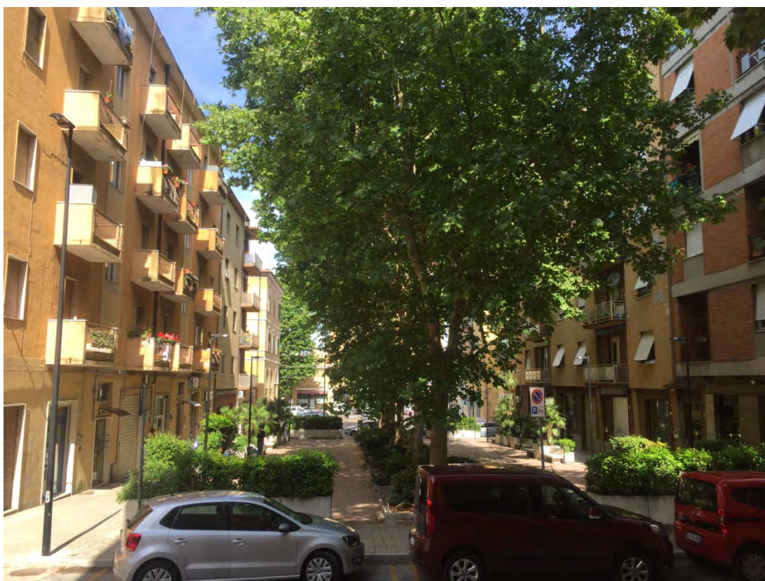
Immagine 4: Vista dalla chiesa verso la piazza