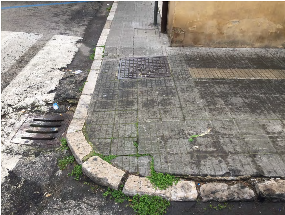
Immagine 9: Particolare del marciapiede