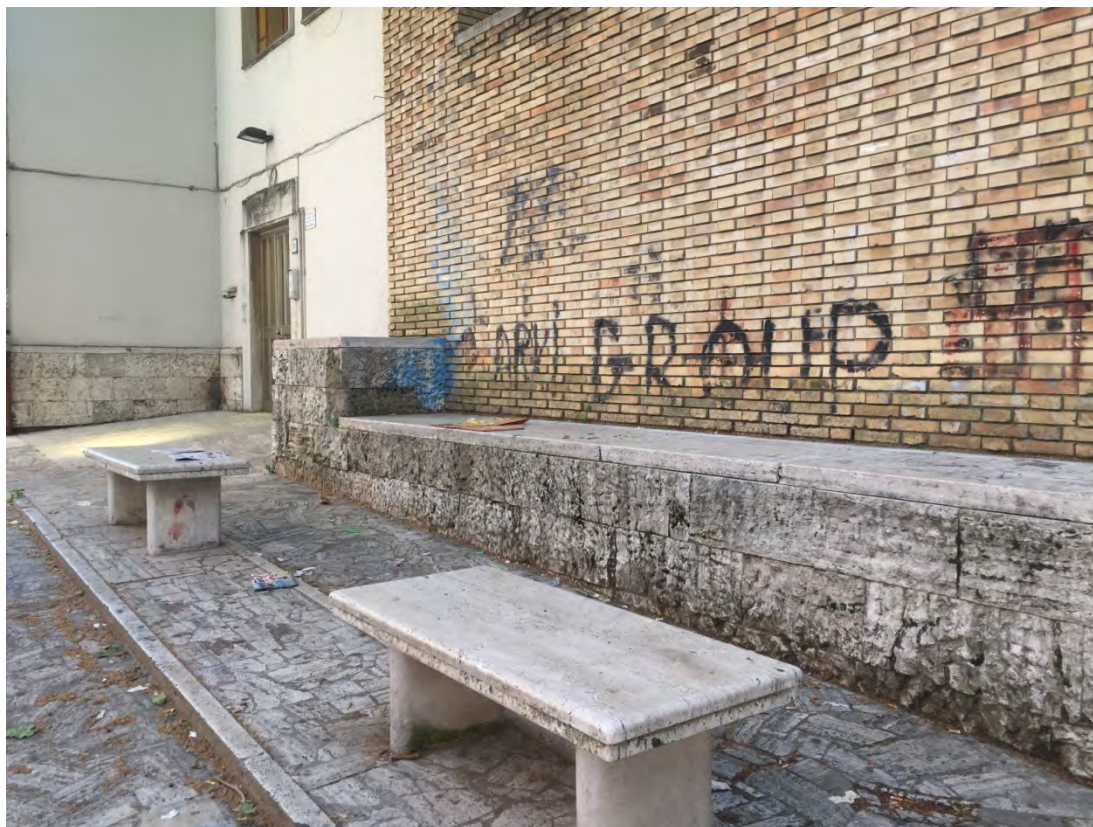
Immagine 19: Dettaglio marciapiede chiesa