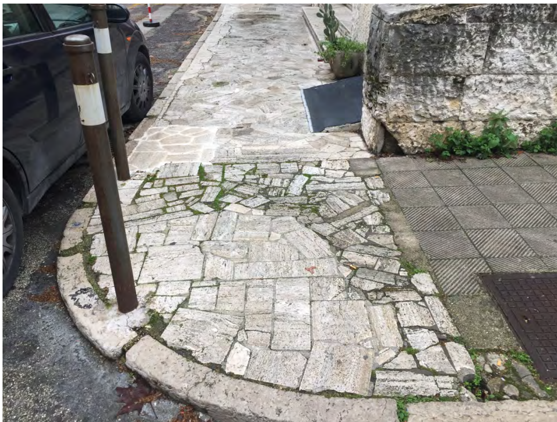
Immagine 17: Dettaglio marciapiede chiesa