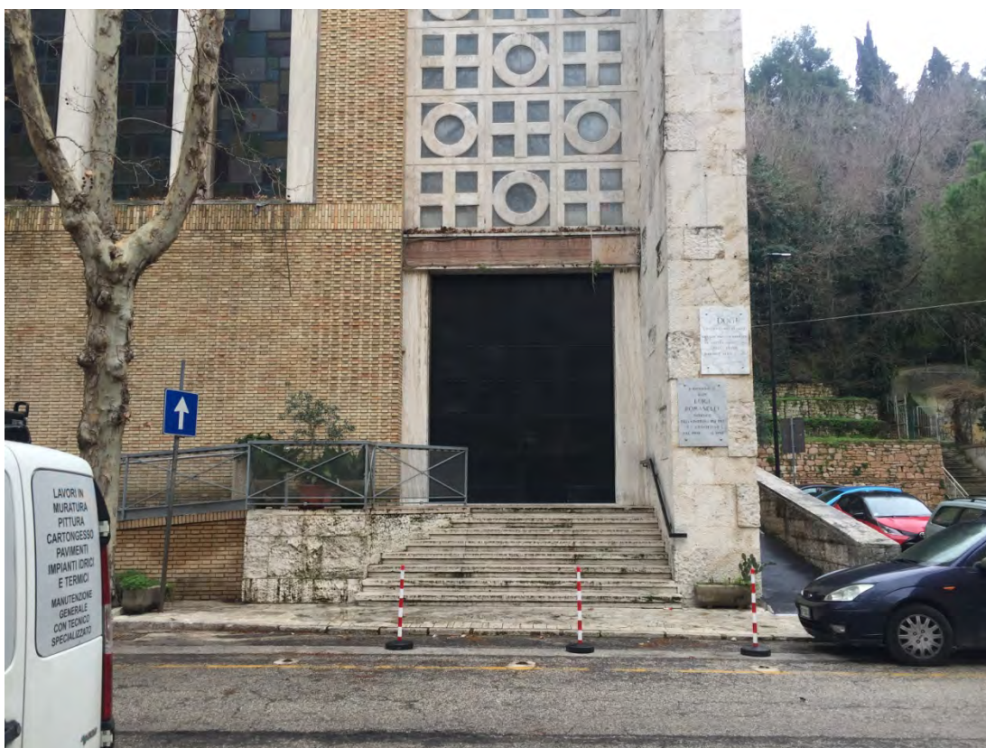
Immagine 16: Dettaglio vista verso la chiesa