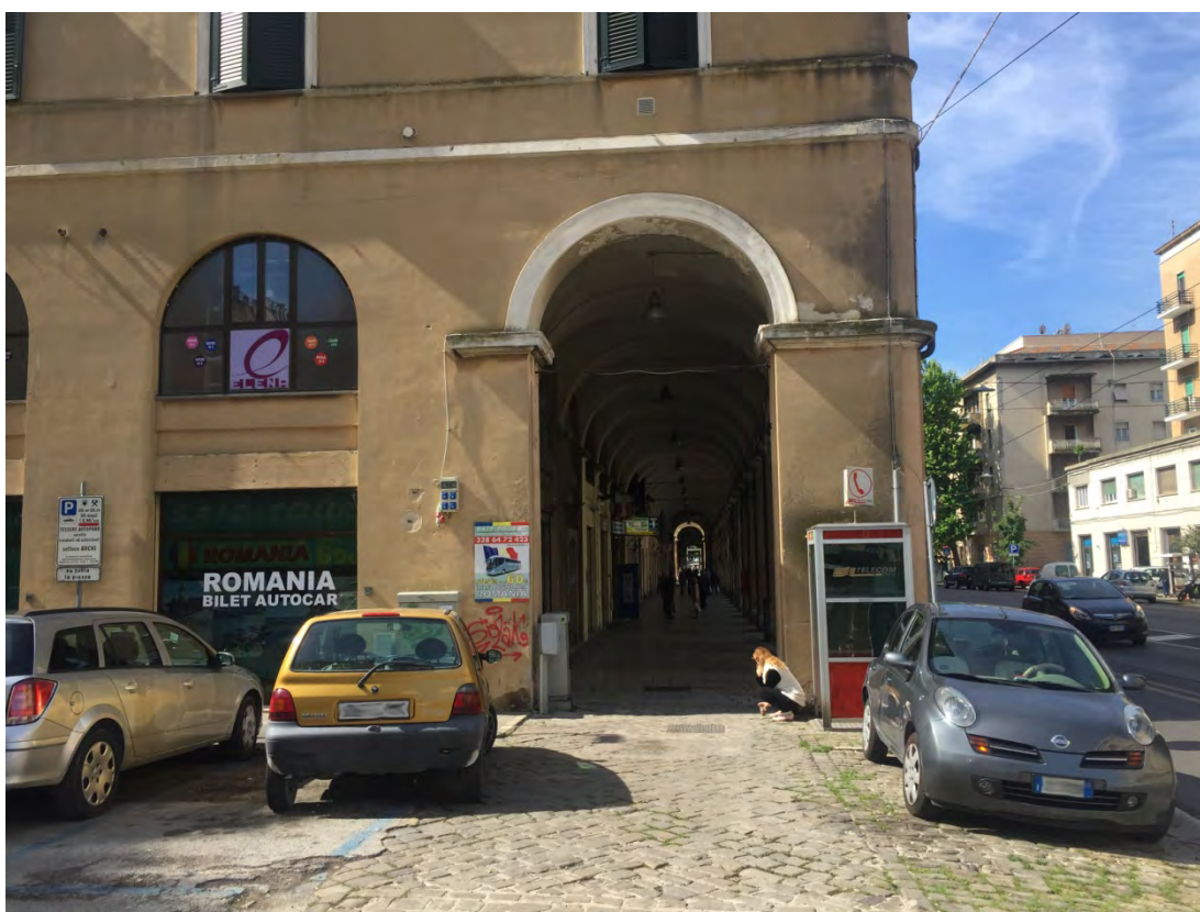
Immagine 6: Vista della piazza verso sud