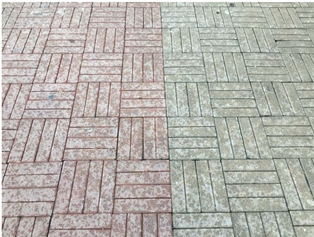
Immagine 11: Particolare della pavimentazione