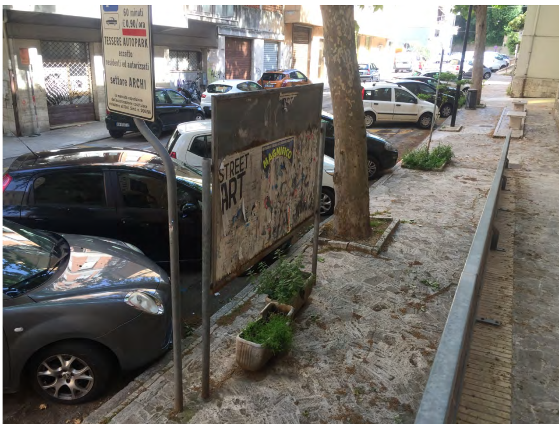
Immagine 18: Dettaglio marciapiede chiesa