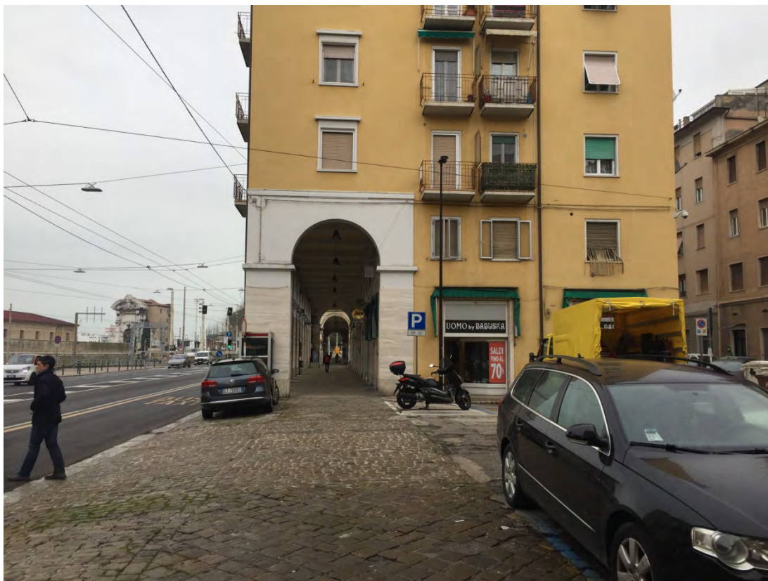
Immagine 5: Vista della piazza verso nord