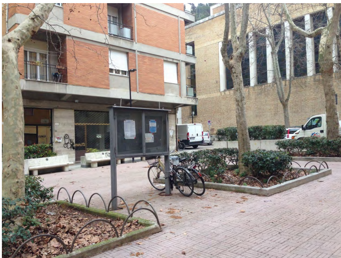
Immagine 14: Dettaglio piazza interna