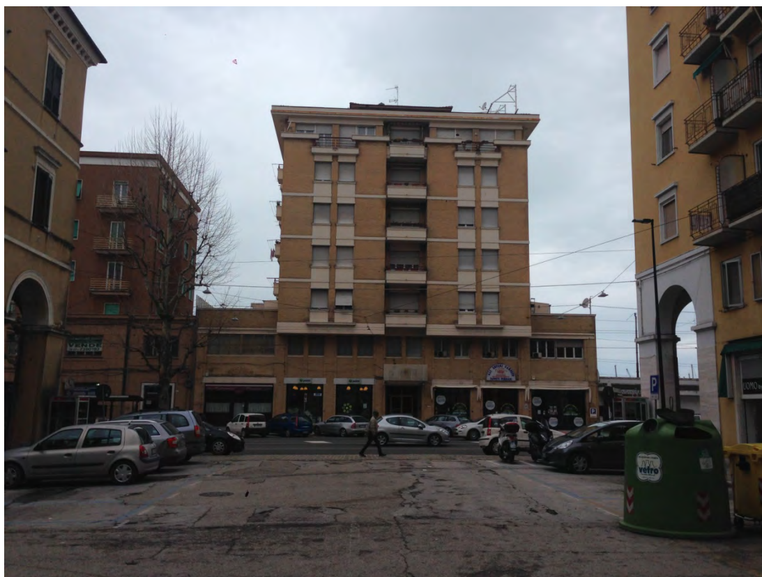
Immagine 2: Vista dalla piazza verso G. Marconi