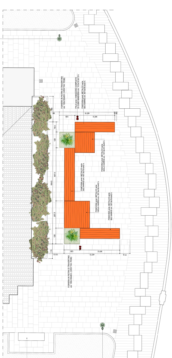
PANCHINE AREA PORTA PIA - PIANTA - RAPP. 1: 50