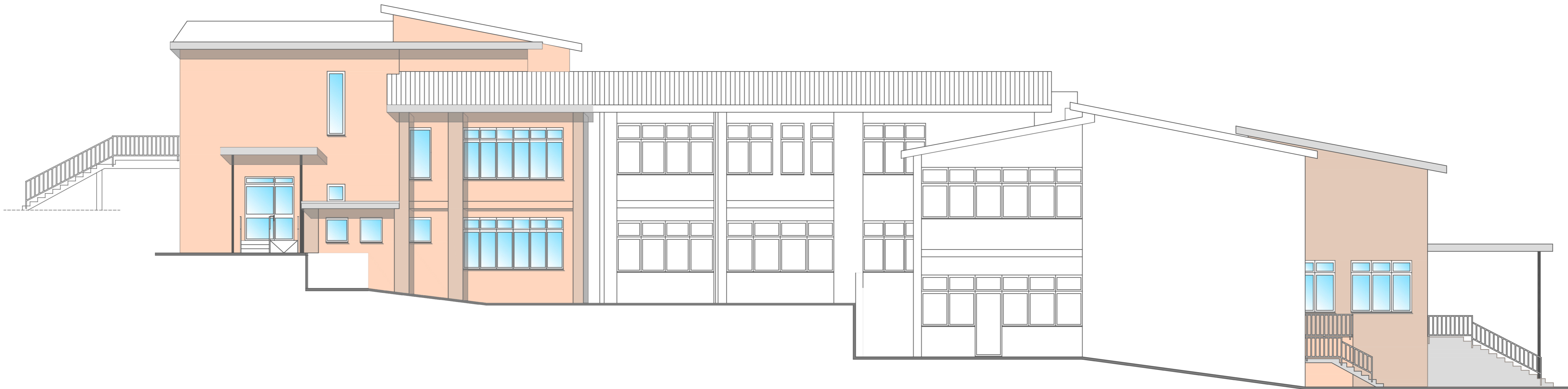
PROSPETTO NORD OVEST - CORPO D E B