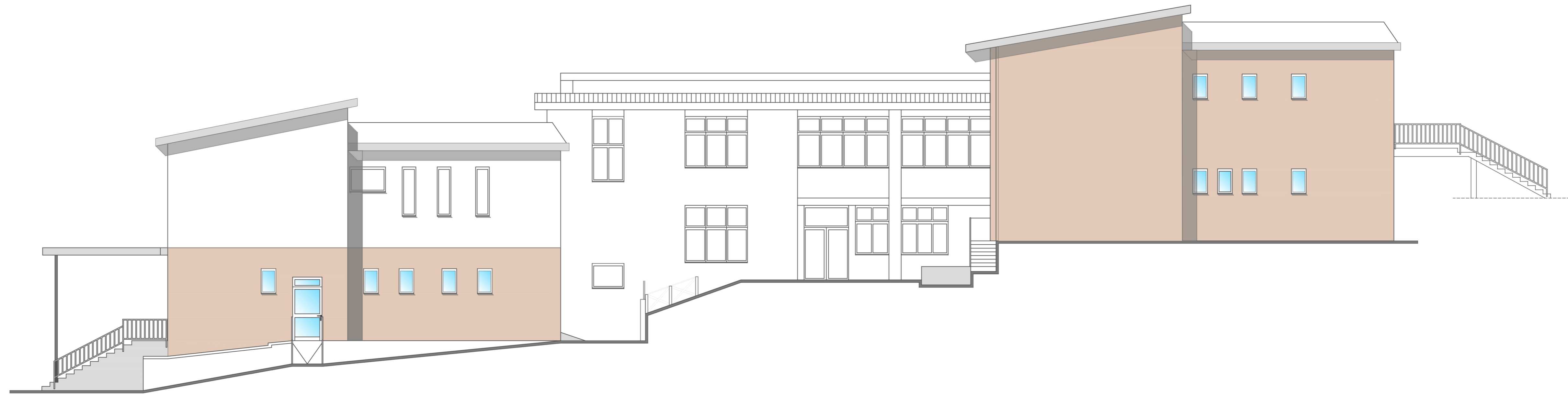
PROSPETTO SUD EST - CORPO B E D

Ing. CLAUDIO BORDONI, Via Podgora 29, 60124 Ancona; Cell/Tel 349 1325656 / 071 33033 PEC claudio.bordoni@ingpec.eu cod. fis.: BRDCLD86P27A271O; p. I.V.A.: 02544970425