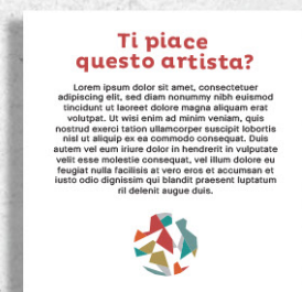
Etichetta/didascalia percorsi musei