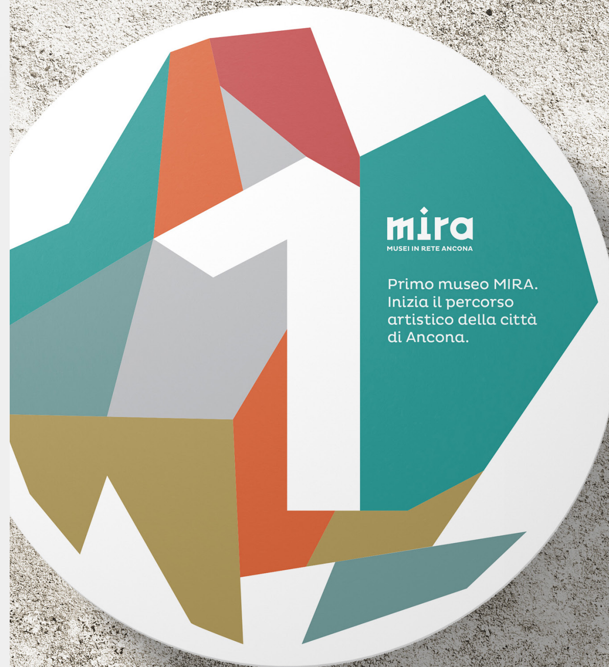
Targhe entrata musei