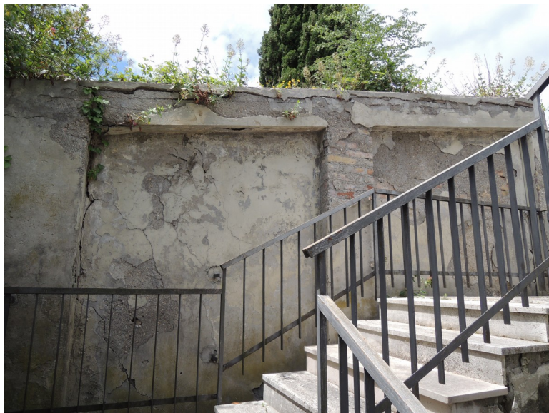
Mura esterne vecchio ingresso