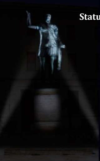
Statua di Traiano