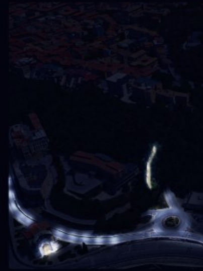
* Mura storiche Cittadella