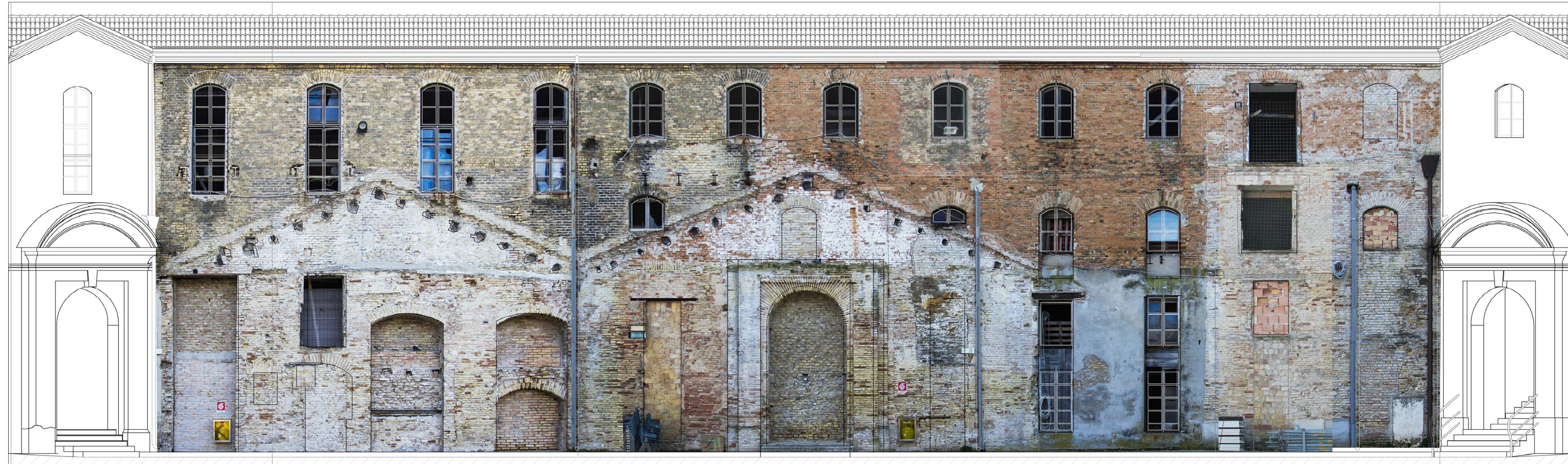
Fotoraddrizzamento Prospetto interno lato b-c