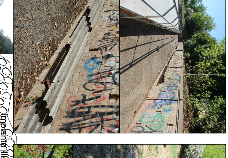
Mani conservativa delle scodelle esistenti