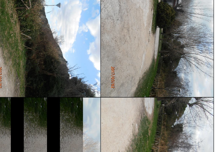
Mani conservativa delle scodelle esistenti