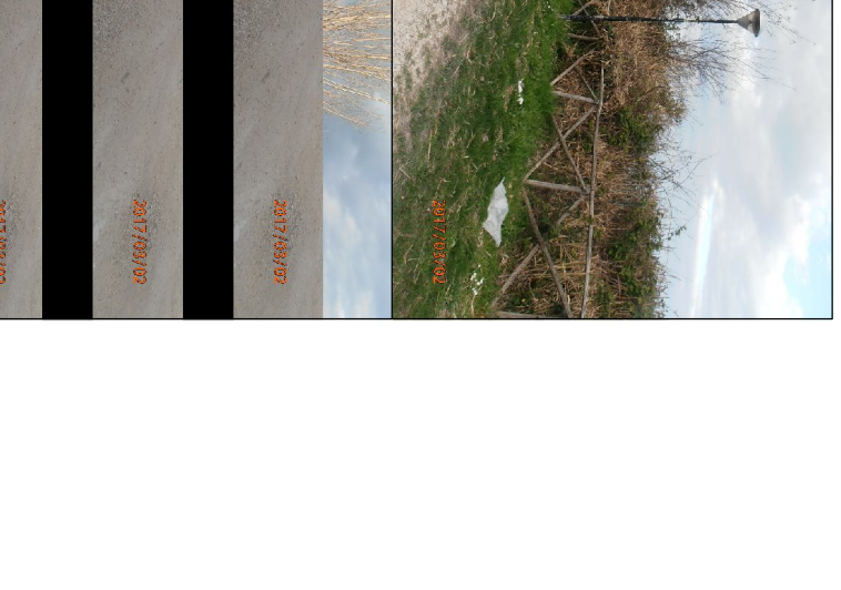
Mani conservativa delle scodelle esistenti