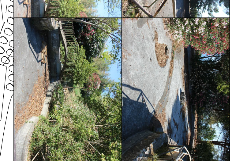
Mani conservativa delle scodelle esistenti