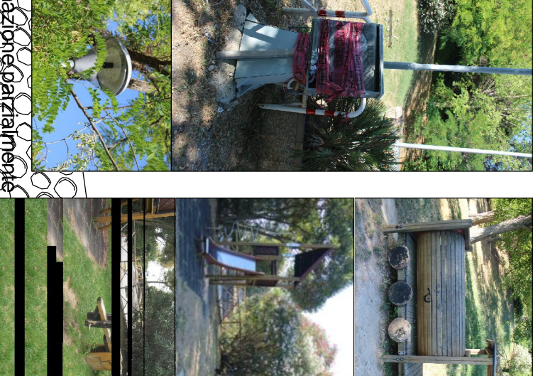
Mani conservativa delle scodelle esistenti