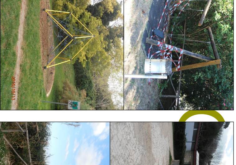
Mani conservativa delle scodelle esistenti