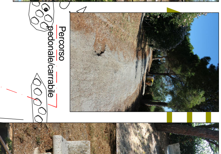
Mani conservativa delle scodelle esistenti