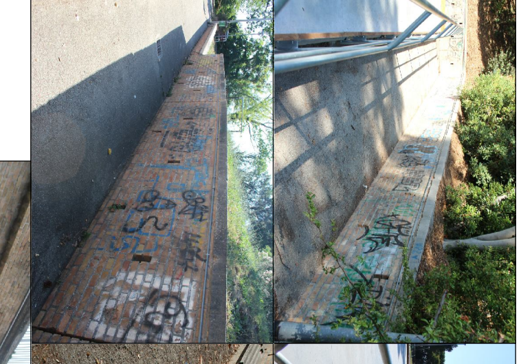
Mani conservativa delle scodelle esistenti