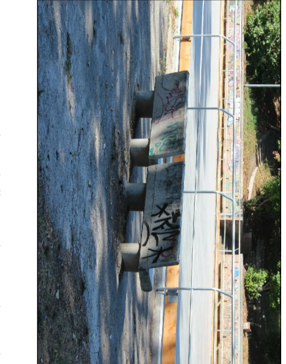
Sono conservativo delle scodelle esistenti