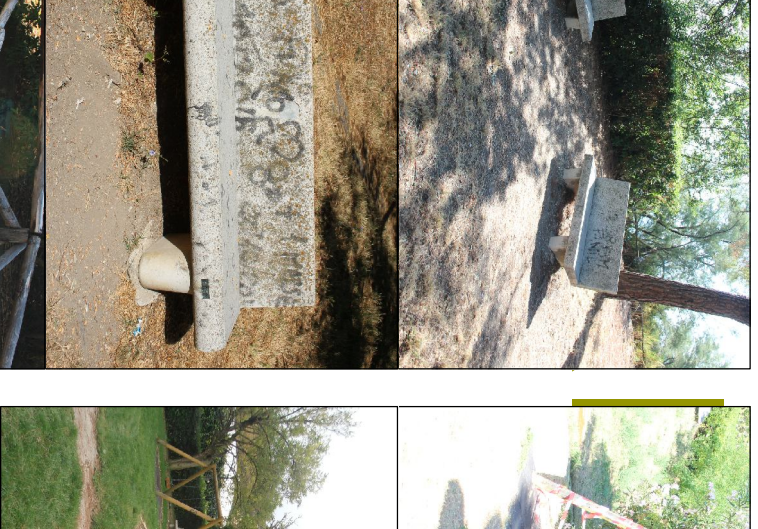
Mani conservativa delle scodelle esistenti