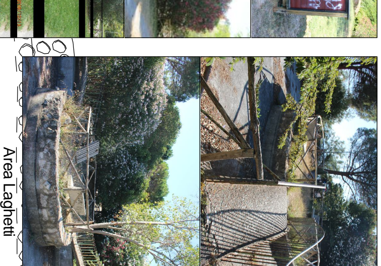
Mani conservativa delle scodelle esistenti