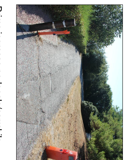
Pieno spessore, impermeabilizzabile (solo autoriscaldati) da addebi. e riciclarne "Passetto"