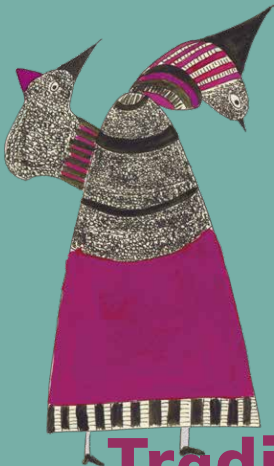
Illustrazione di Giuditta Chiaraluce

Mole Vanvitelliana | festivalstoriancona.it