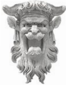
10 I quattro mascheroni tibaldeschi nella facciata

esagonali | 7 | oltre il colmo del tetto, le quali svolgono un ruolo statico contribuendo con il peso a caricare verticalmente le esili spalle delle doppie bifore della Loggia, costituendo un caratteristico espediente costruttivo dell'architettura gotica. Sul pannello centrale della facciata si impenna il Cavaliere Rampante (o cavaliere armato) | 8 | simbolo civico di Ancona e della sua libertà, nato forse dalla tradizione della scultura aurea che rappresentava sul carro l'imperatore Traiano sull'omonimo arco trionfale edificato in porto.