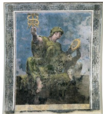
21 La Prudenza