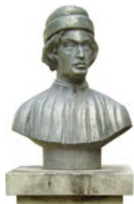
Giorgio di Matteo da Sebenico

pietra d'Istria cavata nell'isola di Brac. Giunse ad Ancona a metà del '400, gli anni della maggiore fortuna commerciale del porto, chiamato da Dionisio Benincasa, il più facoltoso armatore dell'Adriatico fuori Venezia. Venne ingaggiato dai Benincasa per realizzare la facciata del palazzo che la famiglia stava acquistando in prossimità della Loggia. Giorgio di Matteo si candidò alla realizzazione della facciata della Loggia e nel 1451 il governo di Ancona, colpito dalla maestosità dei bozzetti, lo incaricò della costruzione. Ad Ancona Giorgio di Matteo propose una propria libertà creativa, una crivellesca tensione motoria nella vivace anatomia delle sue statue,