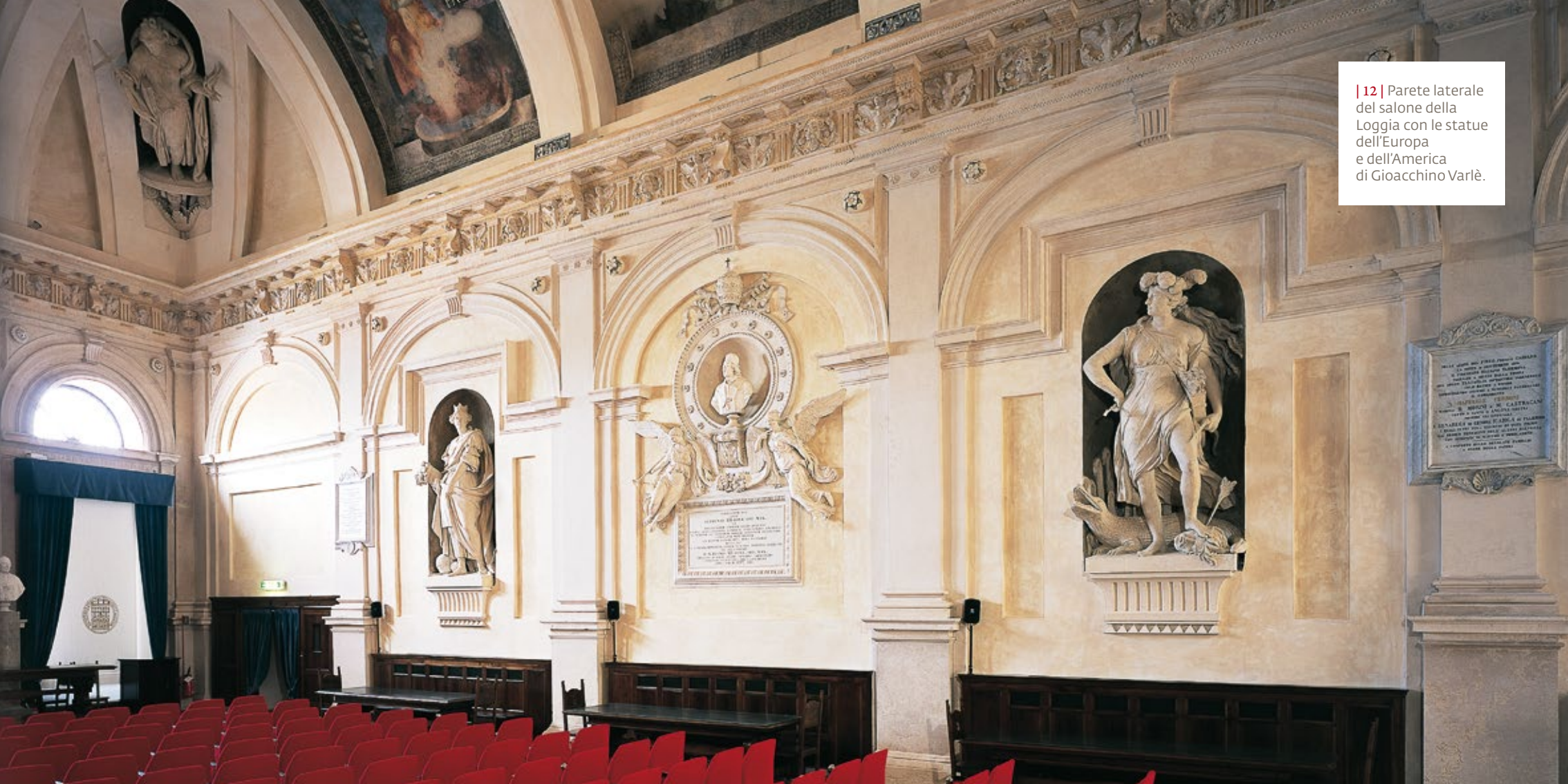
| 12 | Parete laterale del salone della Loggia con le statue dell'Europa e dell'America di Gioacchino Varlè.