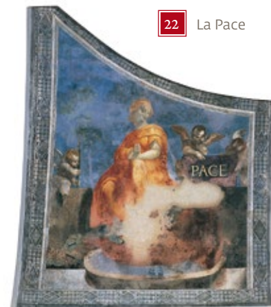
22 La Pace