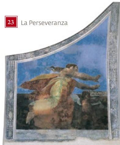
23 La Perseveranza

sappiamo rappresentata con l'immagine di Ercole con la clava e la pelle di leone archetipo dell'eroe e dell'uomo virtuoso. Alla Giustizia, premessa per l'esercizio di tutte le virtù, era dedicato il purtroppo non più visibile affresco centrale, il più complesso, dominato da una figura maschile fiancheggiata da due figure angeliche l'una con la spada (emblema del potere) l'altra con la bilancia (riferita all'imparzialità). La volta celebrava anche l'allegoria della Vittoria, ospitata in origine anch'essa negli spazi quadri come un'immagine femminile trionfante che stringe nella destra la corona d'alloro ed indossa un cimiero piumato. Gli spazi triangolari (velette) sono occupati dalle allegorie della Pace | 22 |, visibile, fiancheggiata da un albero di ulivo; della restaurata Perseveranza | 23 | che esprime resistenza e fermezza d'animo; della Vigilanza (anch'essa distrutta), figura femminile ritratta accanto ad una gru - uccello associato alla virtù del controllo - e della Sapienza | 24 | che ancora oggi è possibile ammirare colta nell'atto di sfogliare un libro. L'intera composizione, anche in omaggio al concetto spaziale di apertura insito nel termine loggia, è stata concepita con l'intento di dilatare lo spazio interno verso l'azzurro indistinto del cielo.