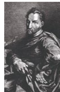
Pellegrino Pellegrini, detto Tibaldi