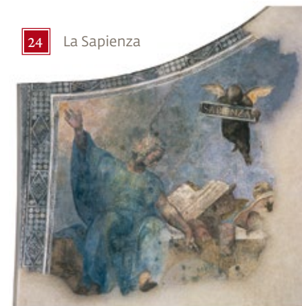
24 La Sapienza