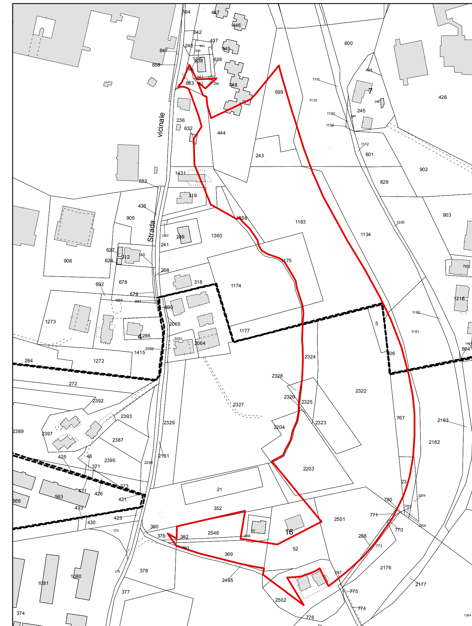
2. individuazione su base catastale - stralcio f.gli 79,97 - scala 1:2000