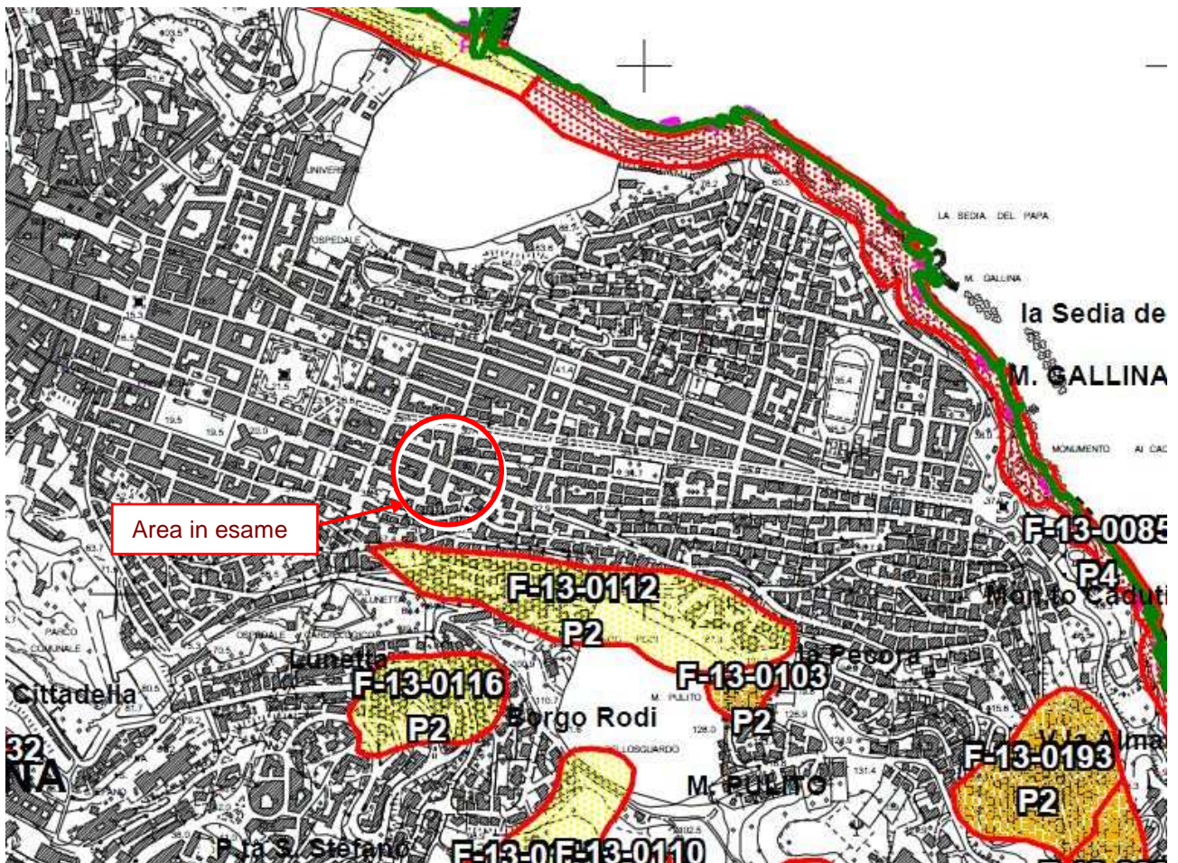
FIG. 3 - STRALCIO TAV. RI23 DEL PAI